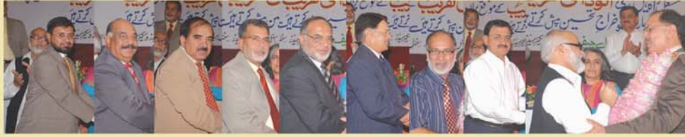
سینئر دفاتر کی جانب سے خراج تحسین

سے کام کرنے کی عادت کی وجہ سے فیلڈ اور مارکیٹنگ ایگزیکٹوز کے مسائل حل کرنے میں میری جس طرح معاونت کی میں ان کا تہہ دل سے شکریہ ادا کرتی ہوں اور آج اس کارپوریشن