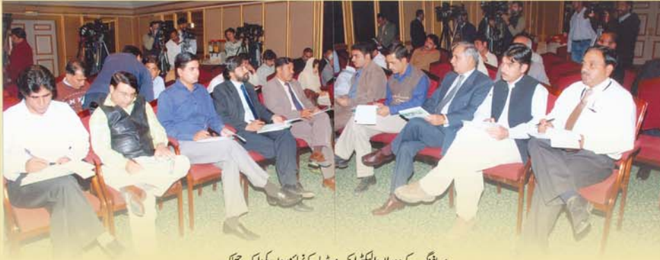
بریفنگ کے دوران الیکٹرانک میڈیا کے نمائندوں کی ایک جھنک

پیشہ ورانہ مہارت سے کام لیتے ہوئے بیمہ زندگی کے پیغام کو قریب قریب، گاؤں گاؤں پہنچا دیجئے۔ میں اس موقع پر تمام مندوبین کو ایک مرتبہ پھر خراج تحسین پیش کرنے کے ساتھ ساتھ کنونشن کے باقاعدہ افتتاح کا اعلان کرتا ہوں۔