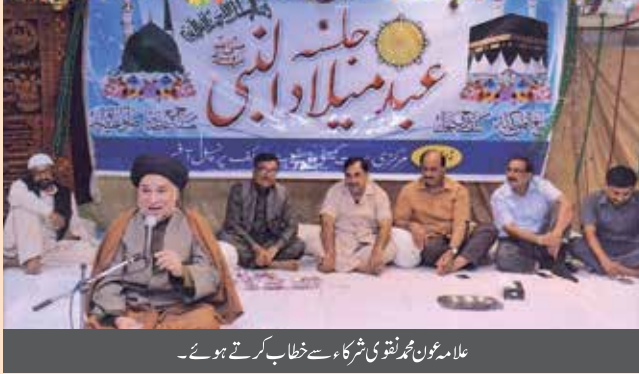
علامہ عون محمد نقوی شرکاء سے خطاب کرتے ہوئے۔