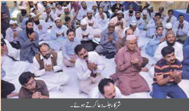
شرکاء جلسہ دعا کرتے ہوئے۔

اس موقع پر مقررین نے اتحاد بین المسلمین کا درس دیا اور آپ ﷺ کی ذات مقدسہ کی تعلیمات