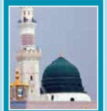
فرمانِ رسول ﷺ

رسول اللہ ﷺ نے فرمایا کہ ”ہوشیار درحقیقت وہ ہے جس نے اپنے نفس کو قابو میں کیا اور موت کے بعد آنے والی زندگی سنوارنے میں لگ گیا، اور بے وقوف وہ ہے جس نے اپنے آپ کو نفس کی ناجائز خواہشوں کے پیچھے لگا لیا اور اللہ پر غلط توقع باندھی۔“