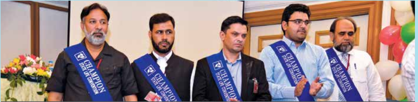
2015 کے ٹاپ کوالیفائیڈز۔