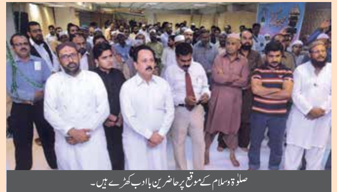
صلوٰۃ و سلام کے موقع پر حاضرین باادب کھڑے ہیں۔

ملت کی سلامتی و خوشحالی، ادارے کی ترقی، ادارے کے مرحومین کی مغفرت، بیماروں کی صحت کے لیے دعائیں کیں۔ (رپورٹ: مرزا اقبال بیگ، ڈپٹی مینیجر لیگل آفیسرز ڈویژن)