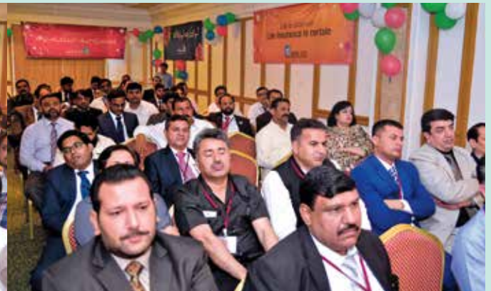
حاضرین خطاب سنتے ہوئے۔