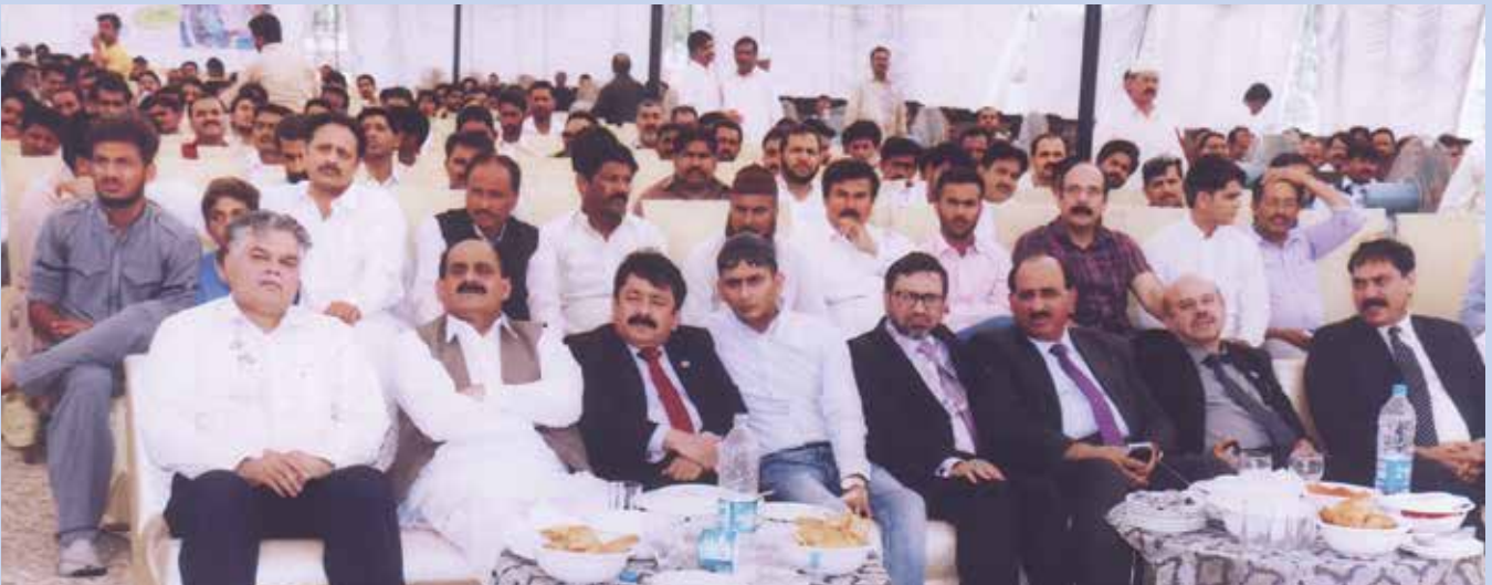
شرکاء جشن بہاراں فیڈ میلہ۔