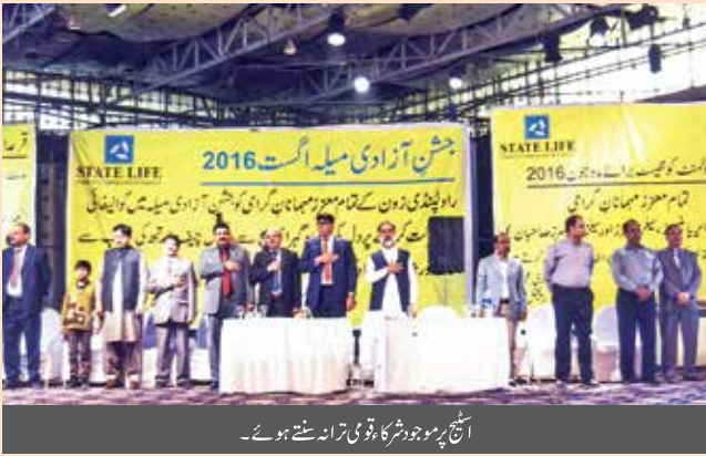
انٹج پر موجود شرکا قومی ترانہ سنتے ہوئے۔