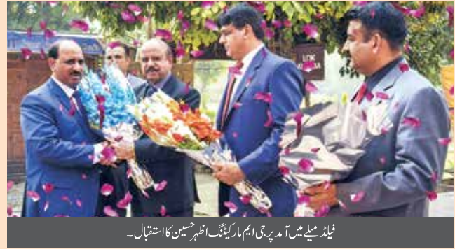
فیلڈ میلے میں آمد پر جی ایم مارکیٹنگ انٹرنیشنل کا استقبال۔

ناردرن ریجن اسلام آباد میں فیلڈ فورس کی حوصلہ افزائی اور ان کی کوششوں کی بھرپور پذیرائی کی گئی دیرینہ روایت کے عین مطابق پاکستان کے جشن آزادی کے موقع پر لوک ورثہ اسلام آباد میں جشن آزادی میلے کا اہتمام کیا گیا جس میں راولپنڈی زون نے ناردرن ریجن میں پہلی پوزیشن حاصل کر کے کوالیفائی کیا۔ راولپنڈی زون کے کوالیفائرز کی بھاری تعداد نے بھرپور انداز میں شرکت کی۔ اس موقع پر پنڈال کو نہایت خوبصورتی سے سجایا گیا تھا۔