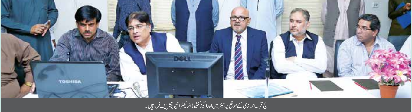
حج قرعہ اندازی کے موقع پر چیئرمین اور ایگزیکٹو ڈائریکٹر ایچ پرنسپل آفس