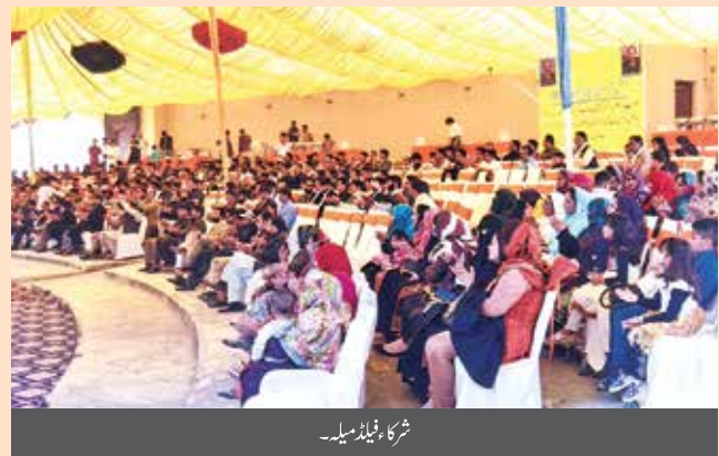
شرکا فیلڈ میلے۔

اس موقع پر خطبہ صدارت میں جناب انٹرنیشنل، ڈویژنل ہیڈ مارکیٹنگ نے اپنی مخصوص شعلہ بیانی