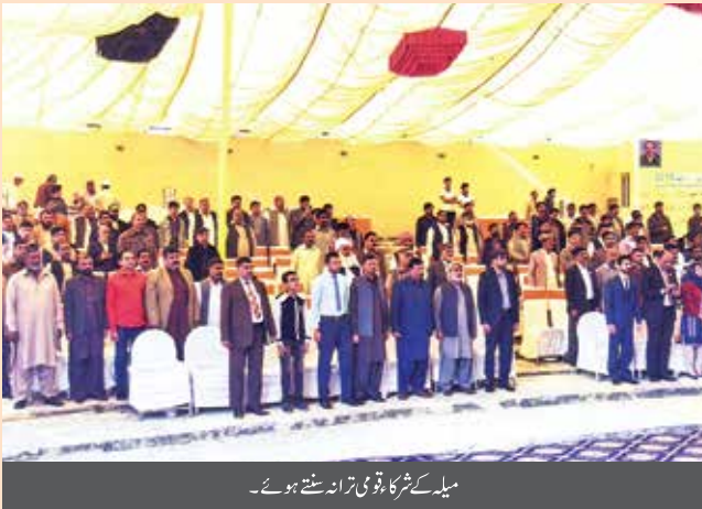
میلے کے شرکا قومی ترانہ سنتے ہوئے۔

(رپورٹ: اسد علی خان، ڈپٹی ایڈیٹر، ریجنل آفس نارٹھ)