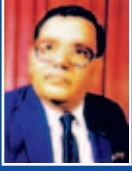
محمد افضل جموعہ سابق ڈپٹی سیکرٹری ہائیڈرو پاور