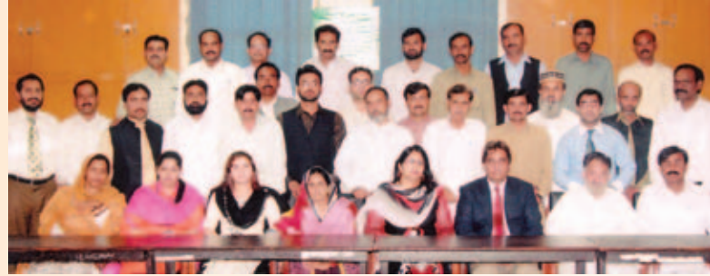
MOSC کورس کے اختتام پر لیگی ایک باڈا کا تصویر