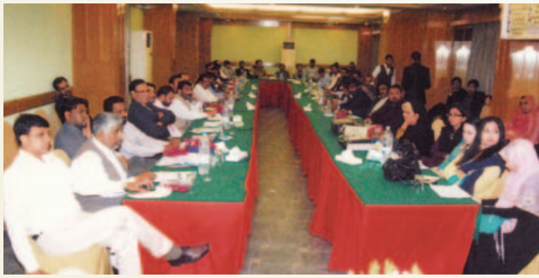
حاضرین کی ایک جھلک