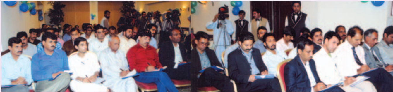
ٹی وی نیوز اور اخبارات کے صحافی حضرات بریفنگ کے دوران