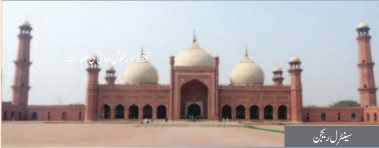
تختہ اور خوش حالی کی ضمانت