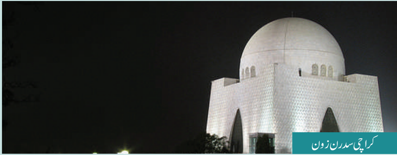
کراچی صدرن زون